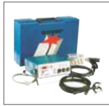
Optionaler Gerätekofter GK-2 zur Aufbewahrung der Bolzenschweißanlage komplett mit Zubehör