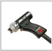
Standardschweißpistole PS-1K PS-1K standard welding gun